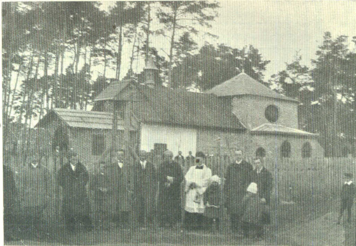
Widok kościoła z członkami komitetu od strony południowej.